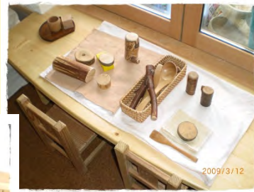
布や木のやさしいおもちゃ 感覚体験を大事にしています

異年齢の子どもたちと兄弟姉妹のように関わり合える機会をたくさんとりいれています。